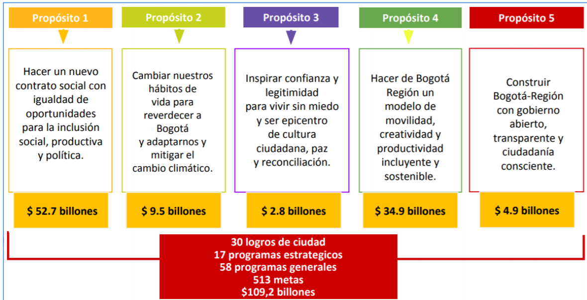
Ilustración 1: Propósitos Plan de Desarrollo 2020-2024

Fuente: Plan de Desarrollo de Bogotá 2020-2024