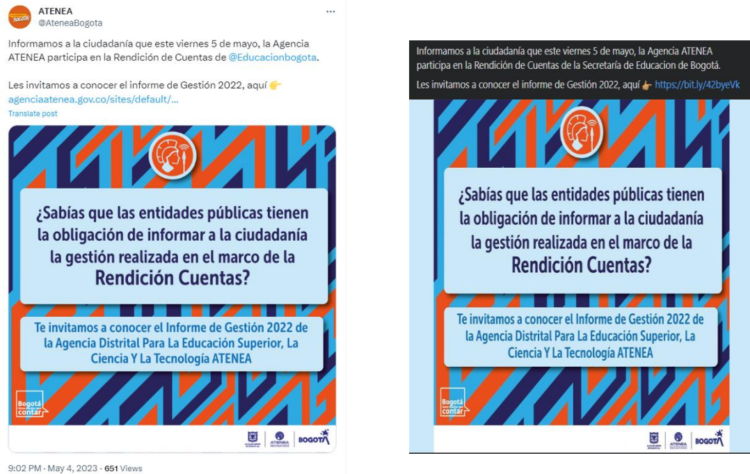
Imagen 1. Publicación de comunicado de audiencia