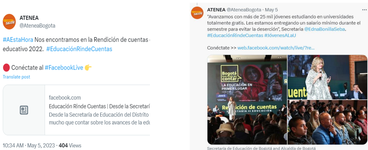
Imagen 5. Difusión del enlace de la audiencia