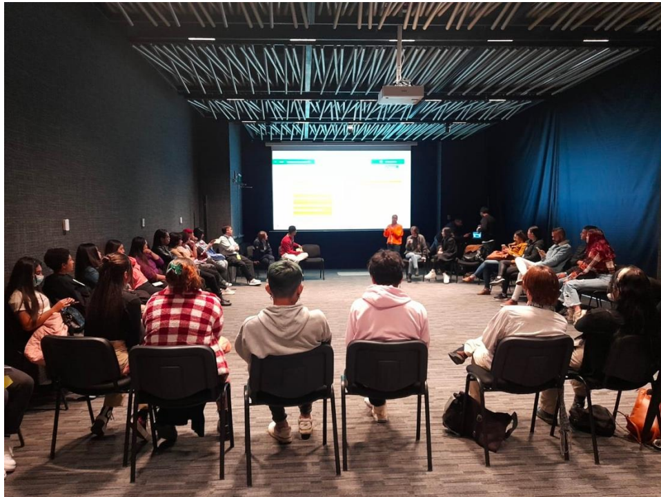
Imagen 14. Espacio cierre de voceros