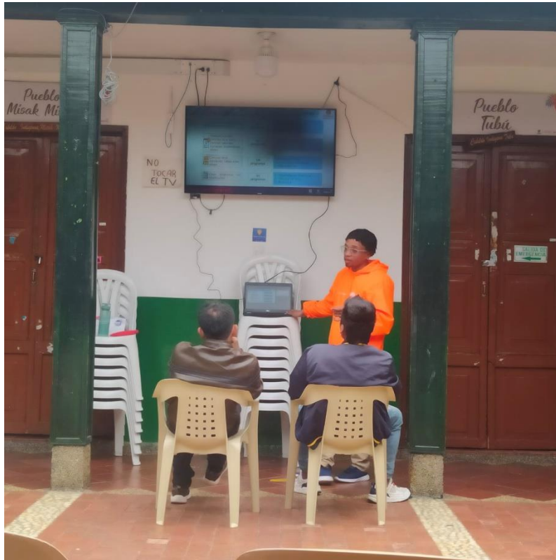
Imagen 11. Socialización con la Mesa Autónoma Indígena