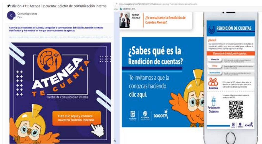
Imagen 2. Difusión en el boletín y Correo institucionales

Esta se realizó por medio del boletín institucional, la página Web por medio de un banner y correo institucional.