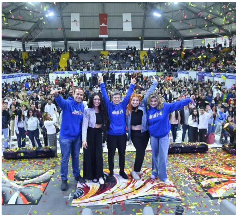
Imagen 10. Festival Jóvenes a la U 6