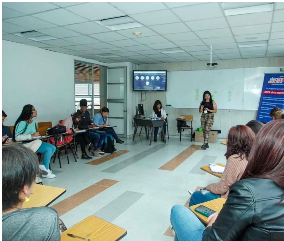
Imagen 15. Espacio inducción nuevos voceros JU