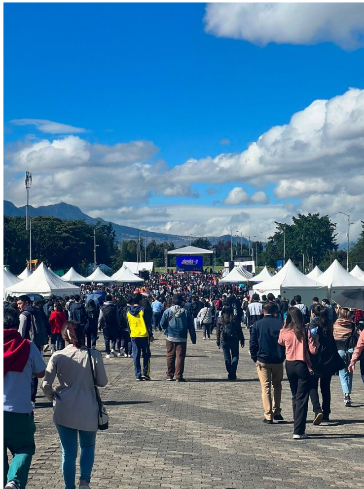
Imagen 9. Festival Jóvenes a la U 5