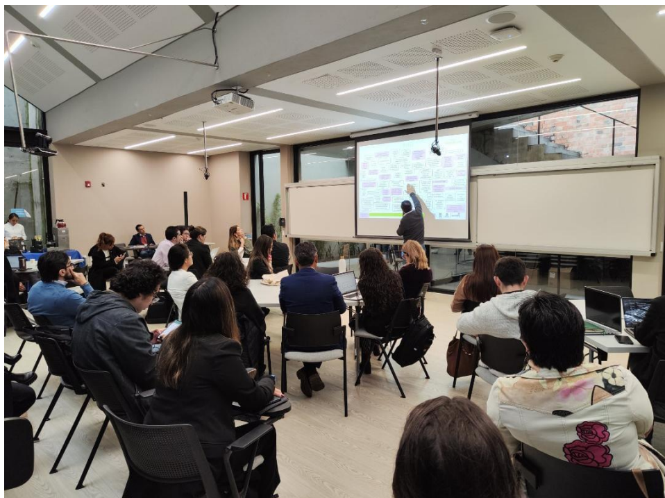
Imagen 16. Bogotá en CocreAcción