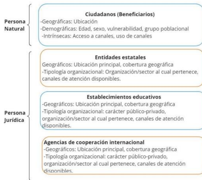
Imagen 7. Nivel y variable por grupo de valor Gerencia de Educación Posmedia

Para la Gerencia de Educación Posmedia, se identificaron cuatro grupos de valor considerando la relación directa con los ciudadanos y la entrega de bienes y/o servicios, se dividen en personas naturales y personas jurídicas, y cada uno cuenta con variables de estudio para su análisis, adaptadas de acuerdo con sus necesidades, intereses, metas, oferta y misión institucional.