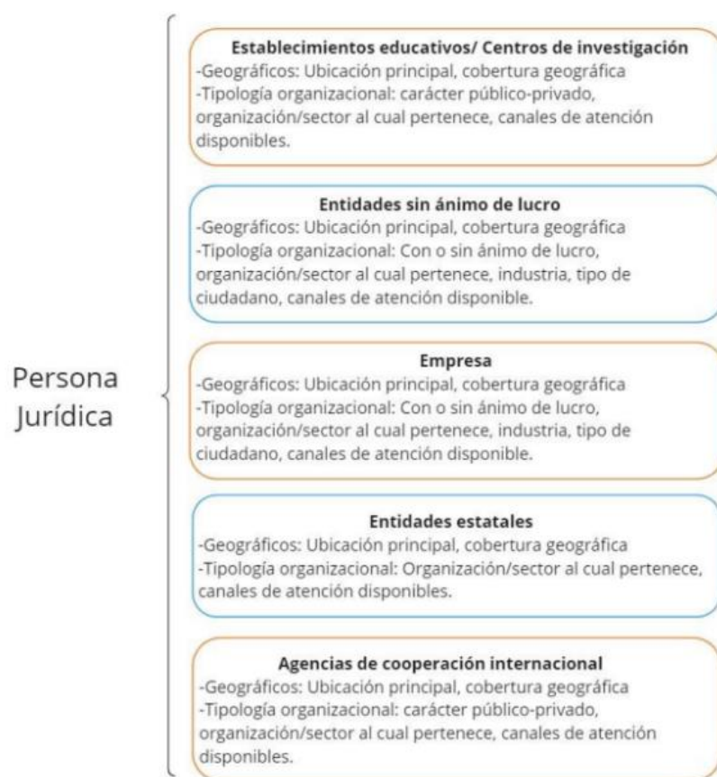
Imagen 8. Nivel y variable por grupo de valor Gerencia de Ciencia, Tecnología e Innovación