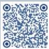
Oferta Lifelong Learning

Nos consolidamos como una IES pionera en acompañar a sus estudiantes en el diseño de rutas de formación y certificación de sus competencias de acuerdo a sus necesidades y momento de vida.