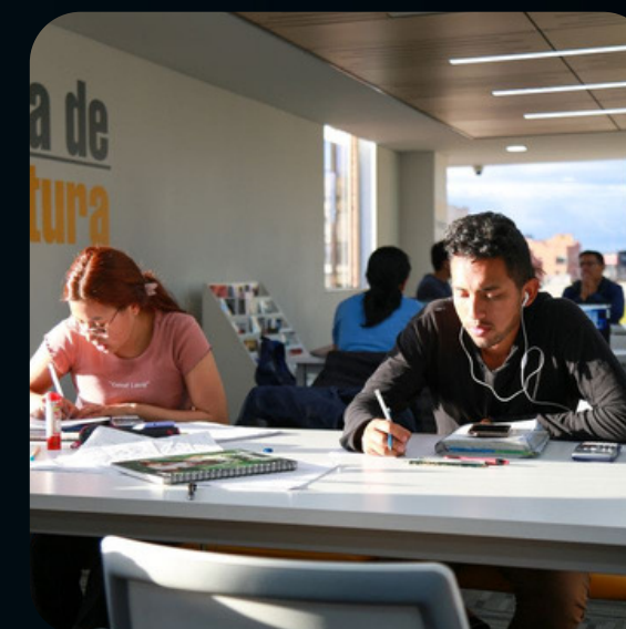
COMUNICACIÓN Y EDUCACIÓN DIGITAL