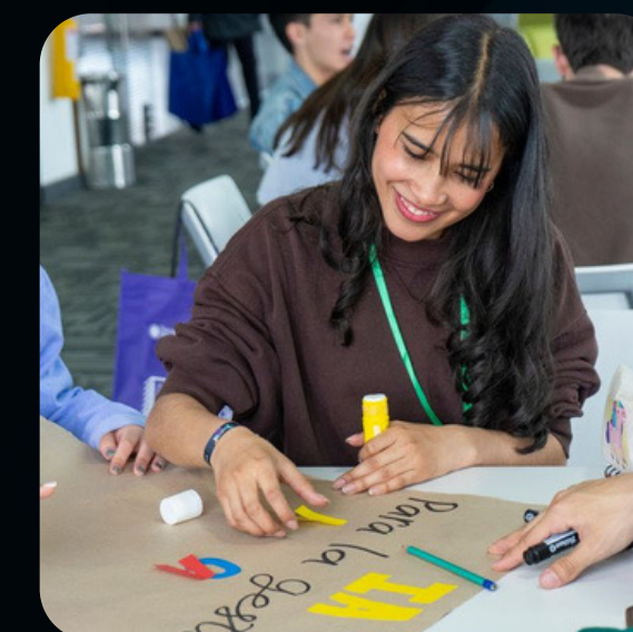
LICENCIATURA EN EDUCACIÓN INFANTIL